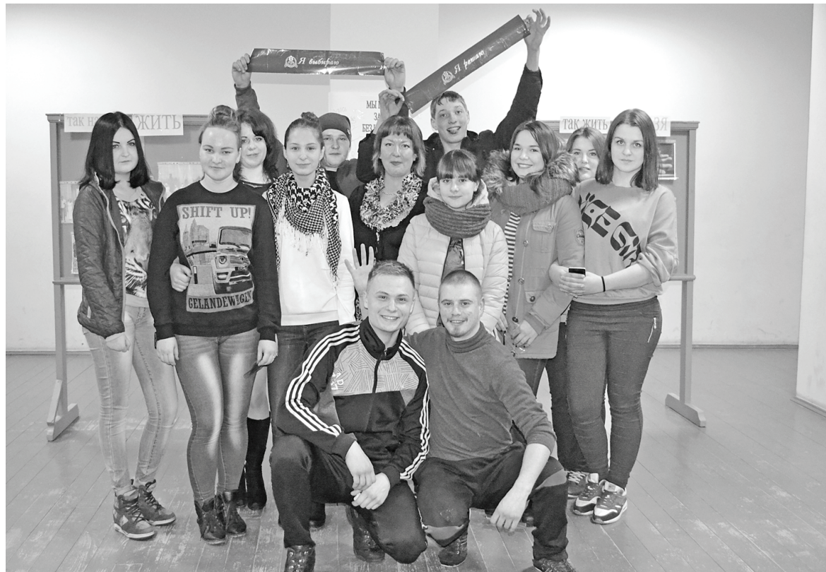
Наша «Туса» - против наркотиков!

В рамках акции «Сообща, где торгуют смертью» в молодёжном клубе общения «ТУСА» при РДК прошла познавательная-игровая программа «Жизнь над пропастью».